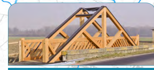
Ponte ciclopedonale a Candiolo