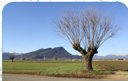
Il Monte San Giorgio a Piossasco

8:15 Ritrovo presso il piazzale del Centro Multimediale, via Alfieri 4. 8:30 Partenza verso Volvera, Chiesa San Giovanni del cimitero.