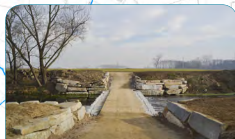
Guado sul Chisola a None