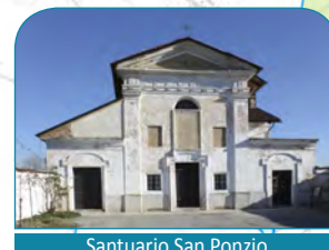
Santuario San Ponzio

9:00 Ritrovo presso Chiesa San Giovanni del cimitero. Attesa dei ciclisti provenienti da Piossasco 9:30 Partenza verso Santuario di San Ponzio di None.