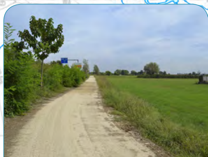
Pista ciclopedonale reg. Brentatori

9:00 Ritrovo al parco giochi di via Monviso e taglio del nastro. 9:15 Partenza verso Cappella agreste di San Giovanni e proseguimento verso il Santuario di San Ponzio.